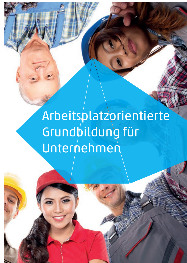
Konzept/Kreation: Agentur 3PUNKTDESIGN, Köln